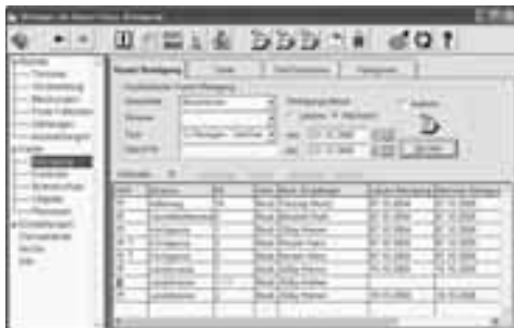
Bild 2: Köbi lässt sich das Programm – anhand der Kartei – ausführlich erklären.